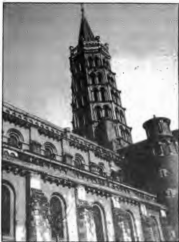
Campanar de Sant Serni de Tolosa